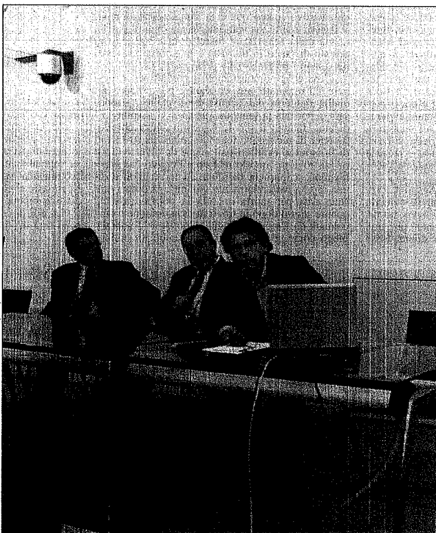
Nella foto, a sinistra, la conferenza di ieri per presentare il portale; a destra, in alto, il rettore Domenico Laforgia

▲ C'è anche una sezione dedicata ai non vedenti ed agli ipovedenti